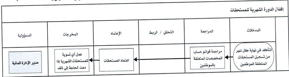
شكل رقم / ٥

يوضح المخطط البياني التالي ( شكل رقم/٥) طريقة تسلسل العمل لإقفال الدورة الشهرية للمستحقات: